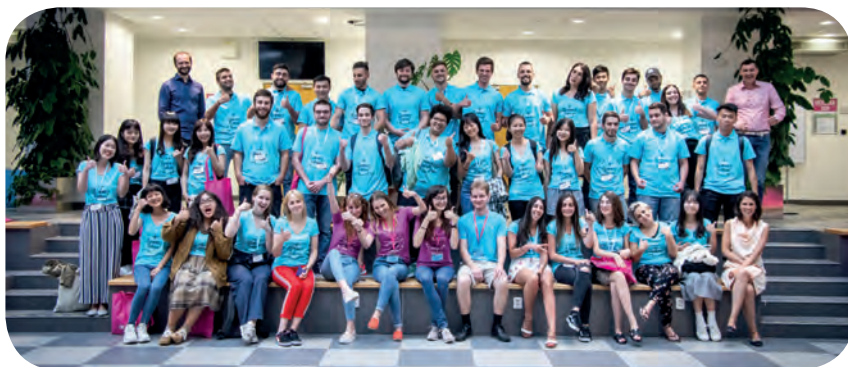
Účastníci prvního ročníku letní školy Marketing Inspiration Summer School 2019

Přestože Fakulta managementu sídlí v malém jihočeském městě, úspěšně se jí daří otevírat se i zahraničí. Díky zapojení do celoškolské partnerské sítě zahraničních univerzit tak pravidelně hostí zahraniční vyučující přijíždějící přes program ERASMUS. Stejně tak hostí fakulta i zahraniční studenty, kteří ji navštěvují v rámci