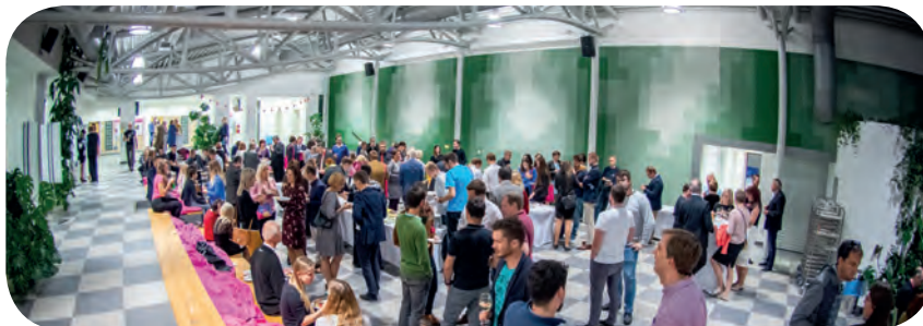
Oficiální oslavy 25 let Fakulty managementu

Pro jindřichohradeckou fakultu byl poslední akademický rok přelomový, alespoň co se týká výuky. Po úspěšné akreditaci nových studijních programů následoval jejich start a poprvé si je tak mohli na vlastní kůži vyzkoušet nově přijatí studenti prvních ročníků.