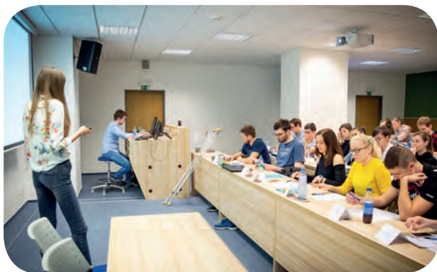
Přednáška Osobní brand a jak na Instagram

programů krátkodobé studentské mobility. Celá oblast internacionalizace prostředí na fakultě je navíc podpořena neustále rostoucí partnerskou sítí vzdělávacích institucí. Do té jsou v současnosti zapojeny čtyři organizace, a to (1) Fakulta podnikového managementu, Ekonomická univerzita v Bratislavě, Slovensko (2) School of Economics and Business, Kaunas University of Technology, Litva (3) College of Management, National Chung Hsing University, Tchaj-wan, (4) University of International Business, Kazachstán. Jednání o rozšíření sítě navíc probíhají např. s University of Primorska (Slovinsko), nebo Polytechnic Institute of Setúbal (Portugalsko).